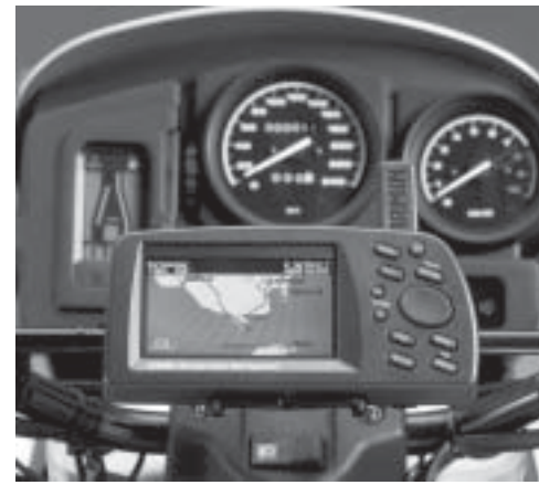
Der BMW-Garmin Navigator

Seit zwei Jahren fahre ich ein Garmin GPS III plus an einer BMW R1100GS spazieren. Als Software nutze ich die Garmin-Software MapSource und QuoVadis von Touratech, inzwischen in der Version 2.50.35.